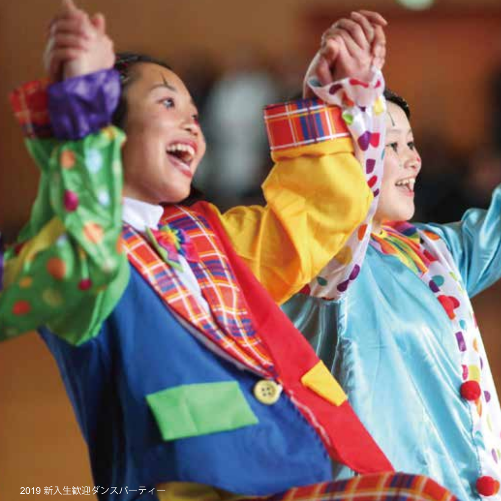
2019 新入生歓迎ダンスパーティー